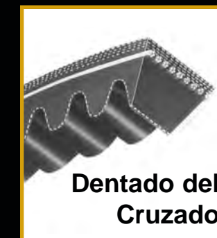
Dentado del Cruzado

La construcción laminada de la tela inferior reduce el ruido en el funcionamiento de la correa.