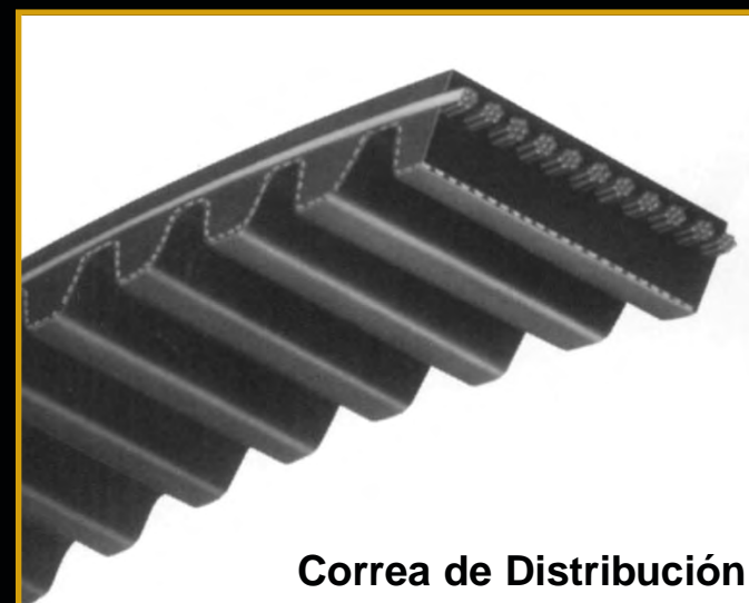
Correa de Distribución

Las cuerdas sintéticas de la fuerza estables, de alta resistencia resisten al encogerse y el estirar.