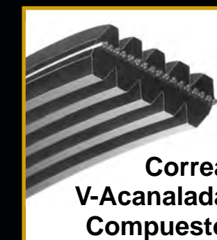
Correa V-Acanalada Compuesto