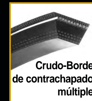
Crudo-Borde de contrachapado múltiple

Confiabilidad probada en el uso de sistemas con o sin tensores automáticos.