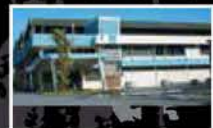
MITSUBOSHI OVERSEAS HEADQUARTERS PRIVATE LIMITED