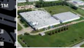
MBL (USA) CORPORATION