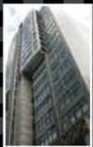
MOI TECH HONG KONG LIMITED