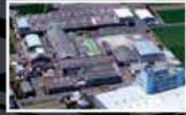
Mitsubishi Belting Ltd. Shikoku Plant