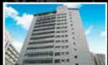
MBL Shanghai International Trading Co., Ltd.