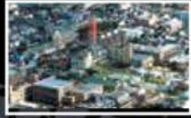
Mitsubishi Belting Ltd. Kobe Plant R&D Center