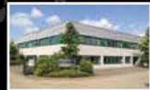
MBL Antriebstechnik Deutschland GmbH