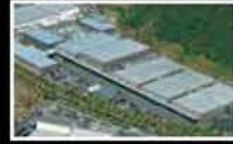
Mitsubishi Belting Ltd. Ayabe Production System Development Center