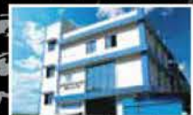
MITSUBOSHI BELTING-INDIA PRIVATE LIMITED