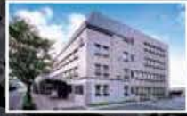
Mitsubishi Belting Ltd. Kobe Head Office