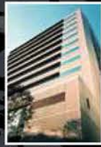
Mitsubishi Belting Ltd. Tokyo Head Office