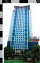
Mitsubishi Belting VIETNAM Co., Ltd.