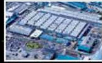
Mitsubishi Belting Ltd. Nagoya Plant