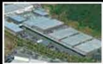
Mitsubishi Belting Ltd. Ayabe Production System Development Center