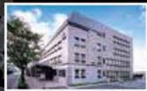
Mitsubishi Belting Ltd. Kobe Head Office