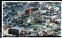
Mitsubishi Belting Ltd. Kobe Plant R&D Center