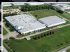
MBL (USA) CORPORATION