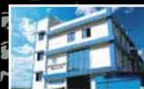
MITSUBOSHI BELTING-INDIA PRIVATE LIMITED