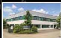
MBL Antriebstechnik Deutschland GmbH