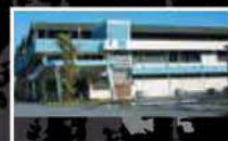
MITSUBOSHI OVERSEAS HEADQUARTERS PRIVATE LIMITED