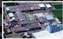
Mitsubishi Belting Ltd. Shikoku Plant