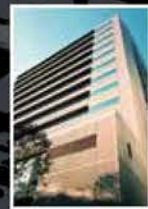
Mitsubishi Belting Ltd. Tokyo Head Office