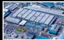
Mitsubishi Belting Ltd. Nagoya Plant